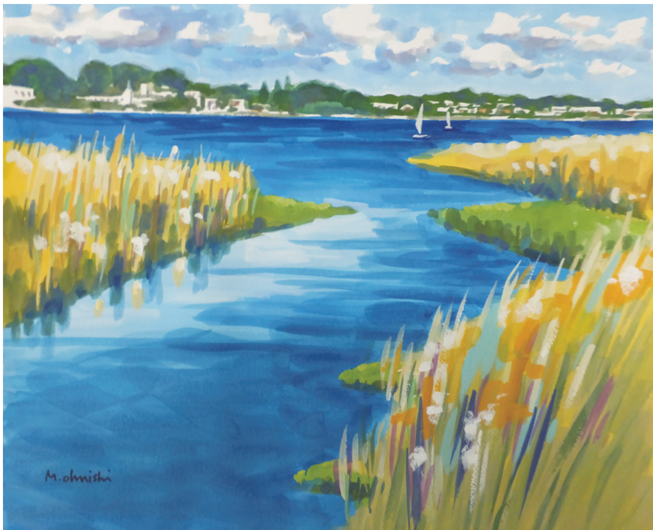
「冬の手賀沼」