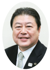
我孫子市長 星野 順一郎

普通の生活を取り戻し、皆様が楽しく、快適に過ごせる日が早く来るよう祈っております。