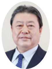
我孫子市長 星野 順一郎