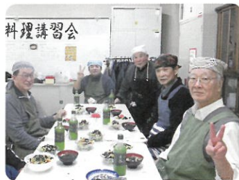
いろいろな講習会