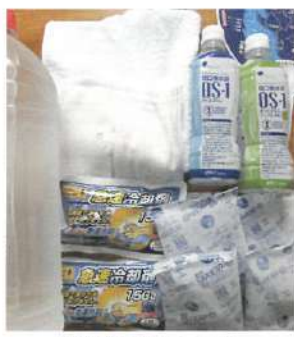
熱中症対応キット

近年の猛暑により、熱中症リスクが社会的な課題として注目されており、全国的には重症・死亡例も発生しています。令和7年度からは事業所における熱中症対策の実施が義務付けられました。これを受け、シルバー人材センターでは、会員の安全を最優先とし、左記のような対策を講じています。 ・熱中症の疑いのある人を早期に発見する体制の整備と周知 ・熱中症の疑いのある人を発見した場合の対応手順の作成 ・熱中症対応キットの常備(冷却剤・経口補水液等) 年齢を重ねると体温調節が難しくなることもあるため、若い世代以上に熱中症対策が大切です。こまめな水分・塩分補給を呼びかけ、安全就業に取り組んでまいります。皆様のご理解・ご協力をお願いいたします。