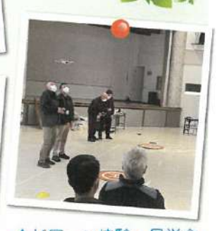
▲ドローン体験・見学会