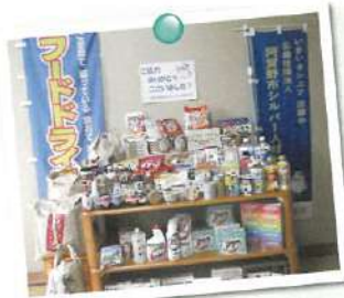
◀シルバーの日 (フードドライブ)