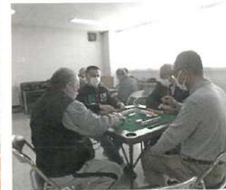
R6.健康マージャン同好会