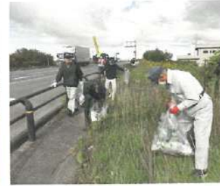
R3.シルバーの日ボランティア