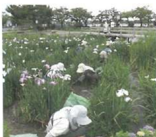
R5.瓢湖あやめ園除草