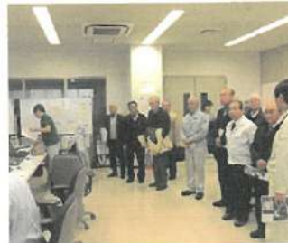
H28.役員研修下越発電管理センター