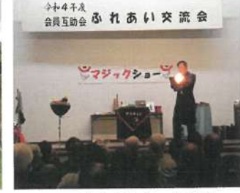
R4.互助会ふれあい交流会