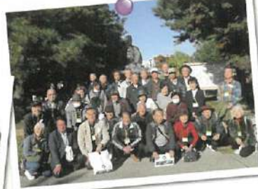
▲互助会ふれあい交流会 日帰りバスツアー