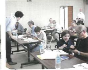
R6.はじめてのスマホ教室