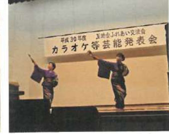
H30.カラオケ等芸能発表会