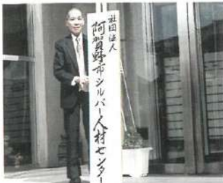
H16.阿賀野市シルバー人材センターに名称変更