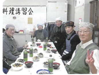
料理講習会 いろいろな講習会