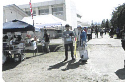
↑ 10月1日 あがの市民まつりパンフレット配布