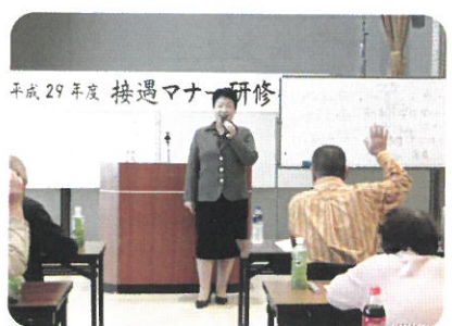
↑ 11月7日 接遇マナー研修会