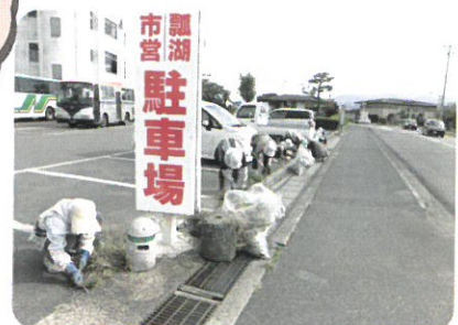
↑ 10月18日 シルバーの日ボランティア(水原地区)