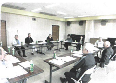
↑ 11月20日 樹木管理職群班長会議