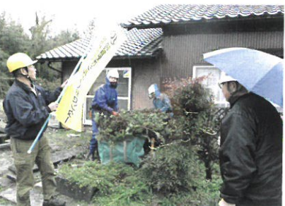
↑ 12月5日 第3回安全パトロール