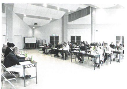
↑ 12月14日 地域正副班長会議