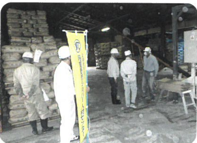
↑ 10月19日 第2回安全パトロール