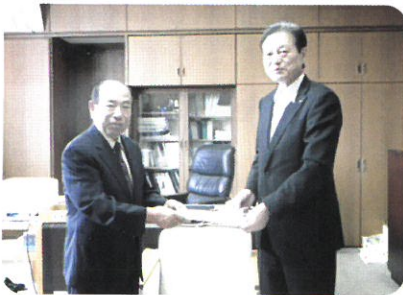
↑ 10月2日 市長へ補助金の陳情