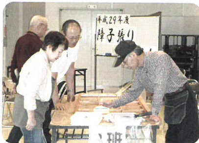
↑ 10月10日 障子張り講習会