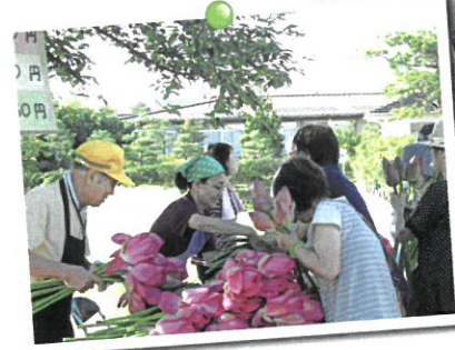
▶ H29. 8. 12 ハスの花刈り、 販売