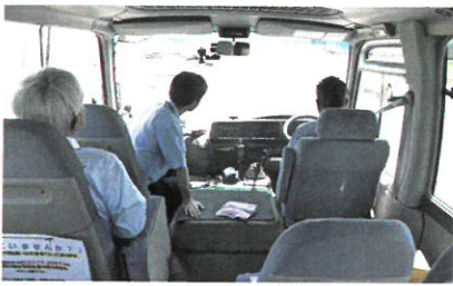
シルバードライバー講習会

登録された会員が就業のために必要な技能の習得、サービスの向上を目的にさまざまな講習会を実施しています。