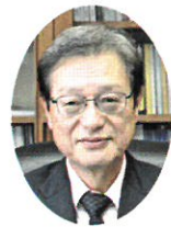
阿賀野市長 田中 清善