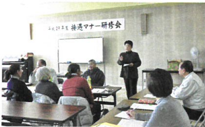
接遇マナー講習会