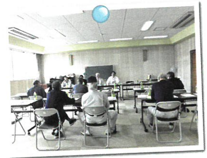
◀ H29. 10. 18 シルバーの日 ボランティア活動 (水原地区)