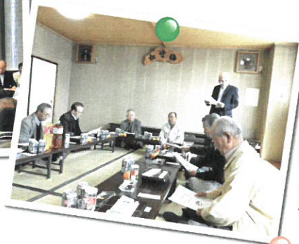
▶ 入会希望者説明会 (月一回)