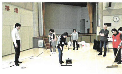
清掃スタッフ講習(施設清掃)