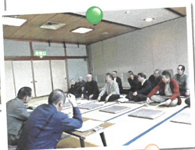
◀令和元年度 定時総会