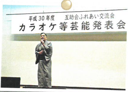
◀互助会 カラオケ等発表会