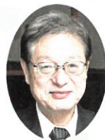
阿賀野市長 田中 清善

記念すべき令和元年の広報『シルバー阿賀野』第二十号発刊にあたり、一言ご挨拶申し上げます。