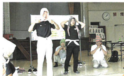
救急法短期講習会