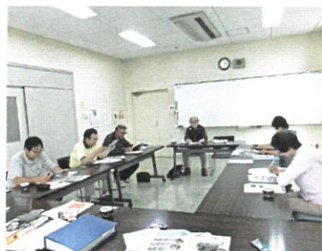
広報委員会 「編集会議の様子」