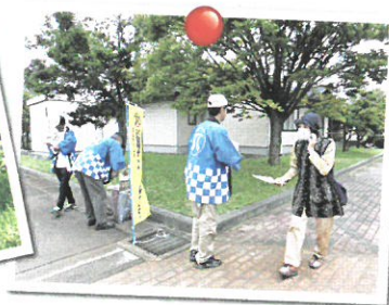
▲シルバーの日 普及啓発活動