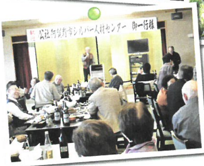
◀互助会 日帰り研修旅行