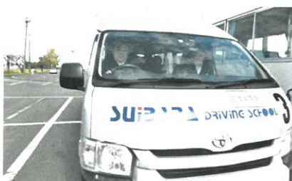
シルバードライバー講習会

登録された会員が就業のために必要な技能の習得、サービスの向上を目的にさまざまな講習会を実施しています。