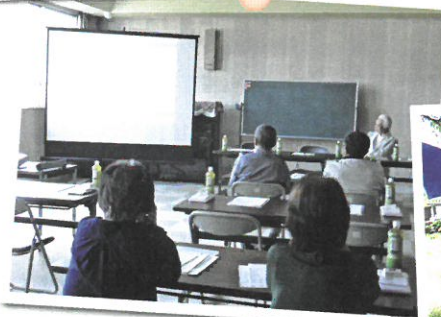
▶入会希望者説明会 (月1回)