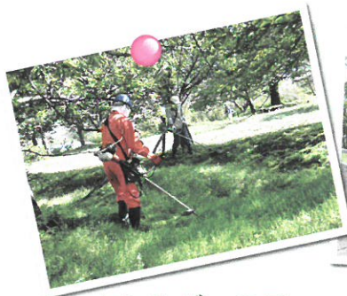
▲シルバーの日 ボランティア活動