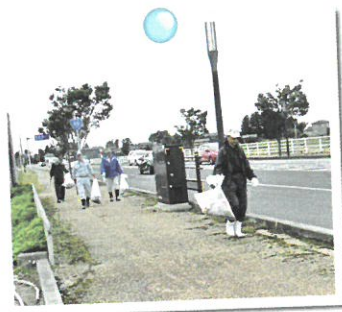
◀シルバーの日 ボランティア活動