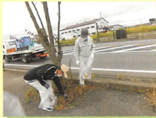
シルバーの日 京ヶ瀬地区