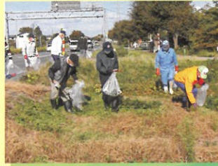
シルバーの日 安田地区