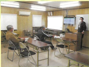
シルバードライバー講習