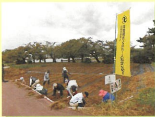
シルバーの日 水原・笹神地区