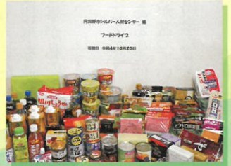
シルバーの日 フードドライブ活動