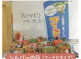
シルバーの日 [フードドライブ]