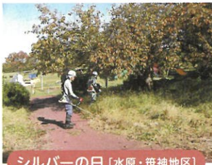
シルバーの日 [水原・笹神地区]