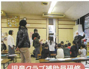
児童クラブ補助員研修