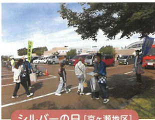
シルバーの日 [京ヶ瀬地区]