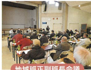
地域班正副班長会議