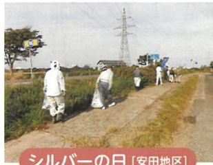
シルバーの日 [安田地区]