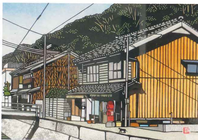
ポストのある風景

素晴らしい剪画の作品展にあこがれた私は、師匠なしでも作品展ができないものかと思案した結果3年後を目途に作品展を開こうと決心し準備に取り掛かりました。