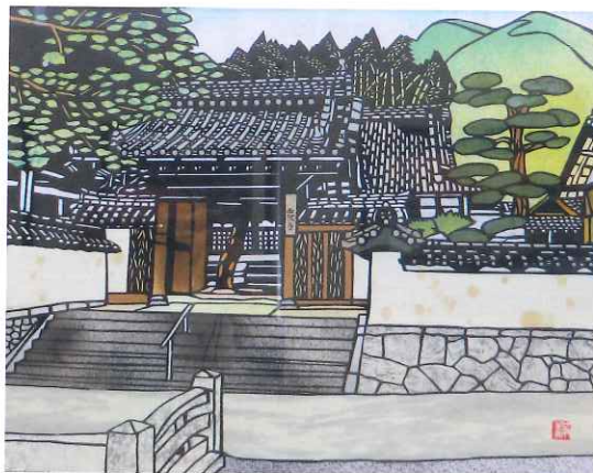
矢野町榊 西教寺山門

作品展を開催させていただきました。当初は、どのくらいの方が来てくれるのか心配していましたが、来ていただいた方たちが、知人などに声掛けをしていただいたおかげで、予想以上の多くの人達に観てもらうことができたことに感激し、作品展を開催できた達成感を味わうことができました。