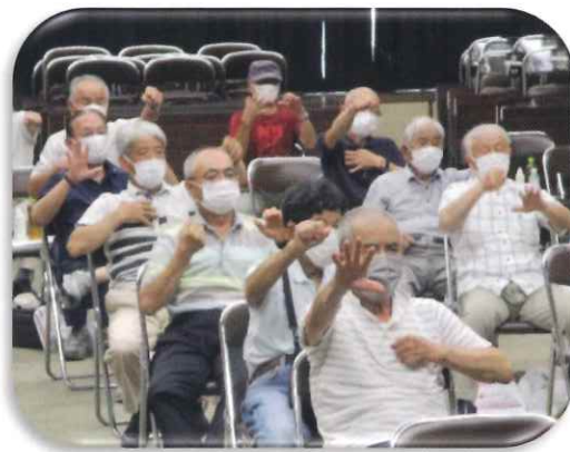
安全就業講習会でのフレイル予防