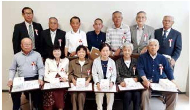
(写真は出席者のみ)

早いもので、入会 10 年になりました。入会のきっかけは、新聞のチラシでシルバー人材センター主催の、無料での剪定講習案内でした。受講終了後入会の説明会があり入会いたしました。 半年後には班長に任命され大変な苦労もありましたが、お客様に喜びと感謝の言葉など頂き頑張ろうの気持ちがいってきます。 これからもチームで力を合わせ、お客様満足度ナンバーワンを目指して成長してまいります。