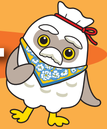
マスコットキャラクター チエブクロ