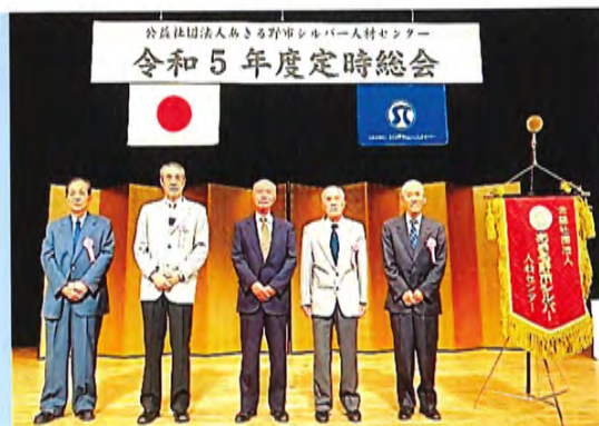
表彰を受けられた方々