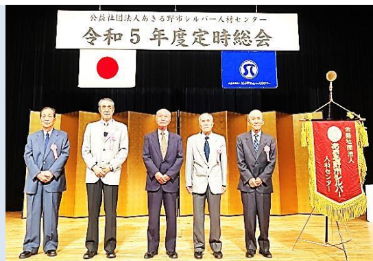
表彰を受けられた方々