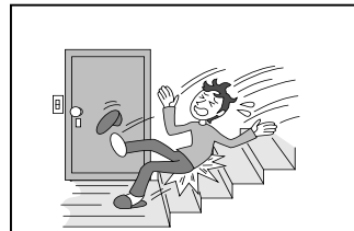
事務所施設の欠陥により 他人にケガをさせた (施設所有管理者特約)