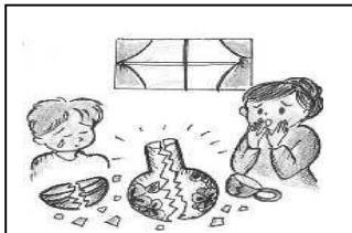
作業中、誤って花瓶や 鉢を壊した (受託者特約)