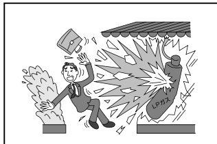
作業完了後、作業の欠陥に より他人にケガをさせた (生産物特約)