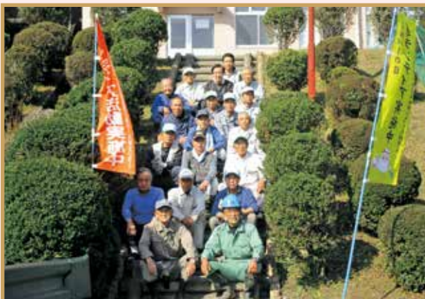
平成30年11月10日 八千代中学校 剪定・草刈り・溝掃除 19名