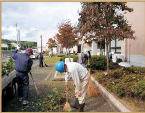
平成30年10月6日 市役所高宮支所 剪定・草刈り・草取り 15名