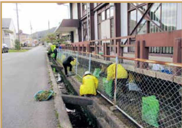
平成30年10月28日 甲田中学校 剪定・草刈り・草取り 31名