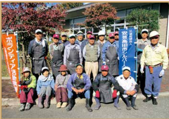
平成30年10月20日 かがやき 剪定・草刈り・清掃 19名