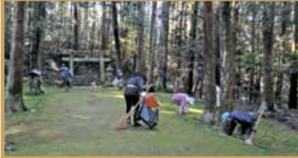
平成30年8月19日 郷野小学校 剪定・清掃 4名 平成30年10月20日 元就墓所・郡山公園周辺 清掃・ゴミ拾い 25名