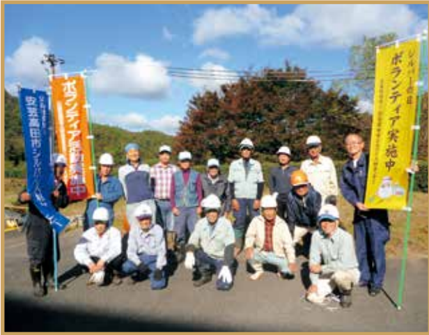
平成30年10月20日 美土里中学校 剪定・草刈り・清掃 16名