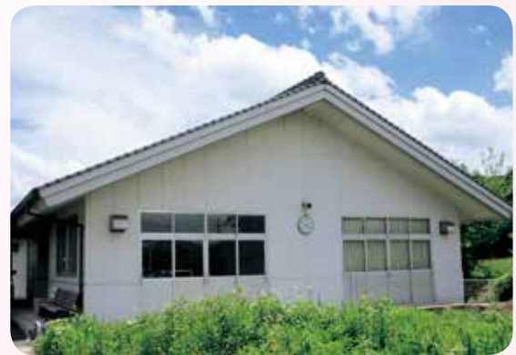
特別養護老人ホーム高美園