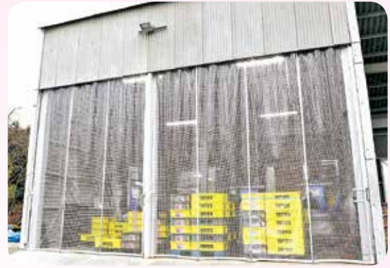
住野工業株式会社 高宮工場