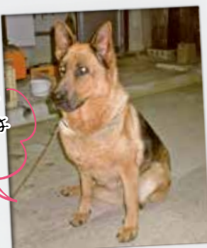
①つやま様 ②テンちゃん・12歳・♀