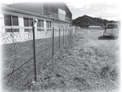
吉田町山手の工場周りの草刈りをし、就業写真を送ったところ

いつもお世話になります 実施後の写真には驚いております。すごくきれいにしています ご協力ありがとうございました