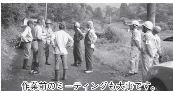
作業前のミーティングも大事です。