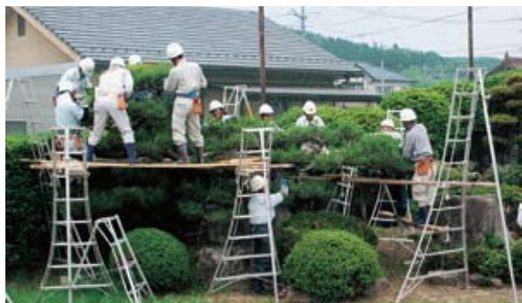
剪定講習会 安芸高田市立甲立小学校 参加者40名 6/7(月)