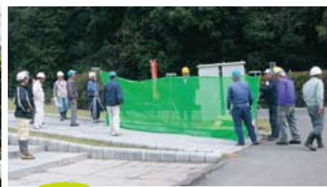
刈払機取扱講習会 向原町ふるさと河原公園 参加者36名 4/13(火)