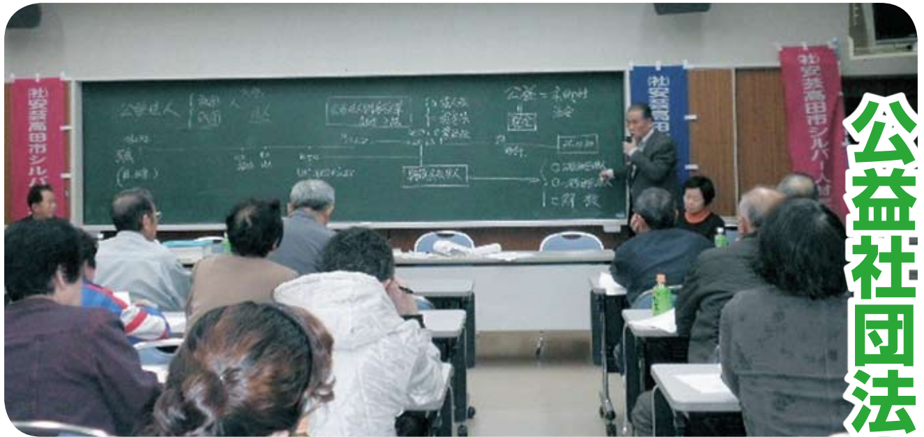
甲田町地域会員会議 (平成22年3月18日)