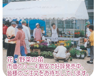
花・野菜の苗 市価の3~4割安で好評発売中。皆様のご注文をお待ちしています。