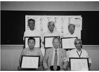
中国新聞 2006年 (平成18年) 7月12日