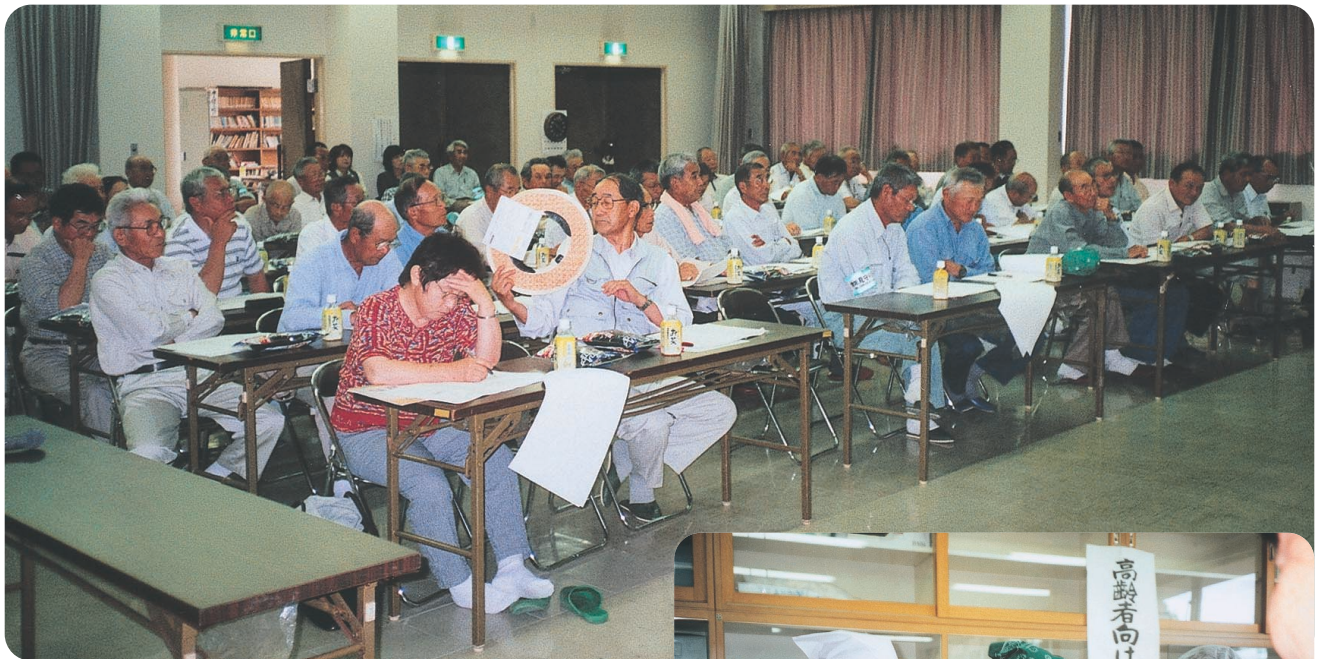
刈払機取扱講習会

■編集・発行 社安芸高田市シルバー人材センター 〒731-0544 広島県安芸高田市吉田町多治比611-1 電話(0826) 42-4411 FAX(0826) 42-1800