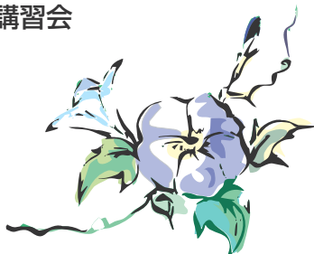
高齢者向け料理講習会