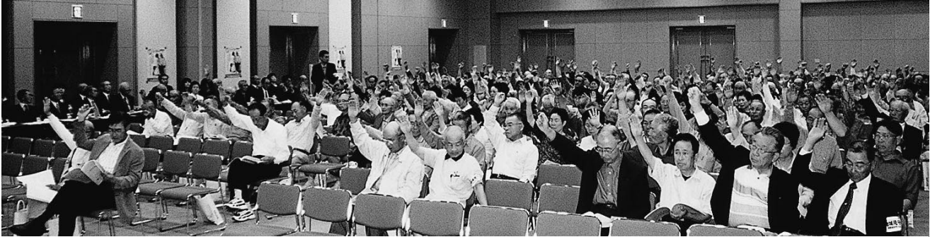
平成18年5月31日通常総会

今年度は、社団法人 安芸高田市シルバー人材センターが発足して2年目であり、「自主・自立・共働・共助」の基本理念のもと「安全が全てに優先する」を念頭に置き、地域の担い手として、地域福祉に貢献し、信頼されるよう、役員・社員・職員の研修を一層深めていきます。また、団塊世代のシルバー会員への参入に備え新たな就業の場の開拓等に努力し、今後のシルバー人材センター事業の更なる発展のためより効率的に事業運営を図り、地域社会の期待に応えていきます。