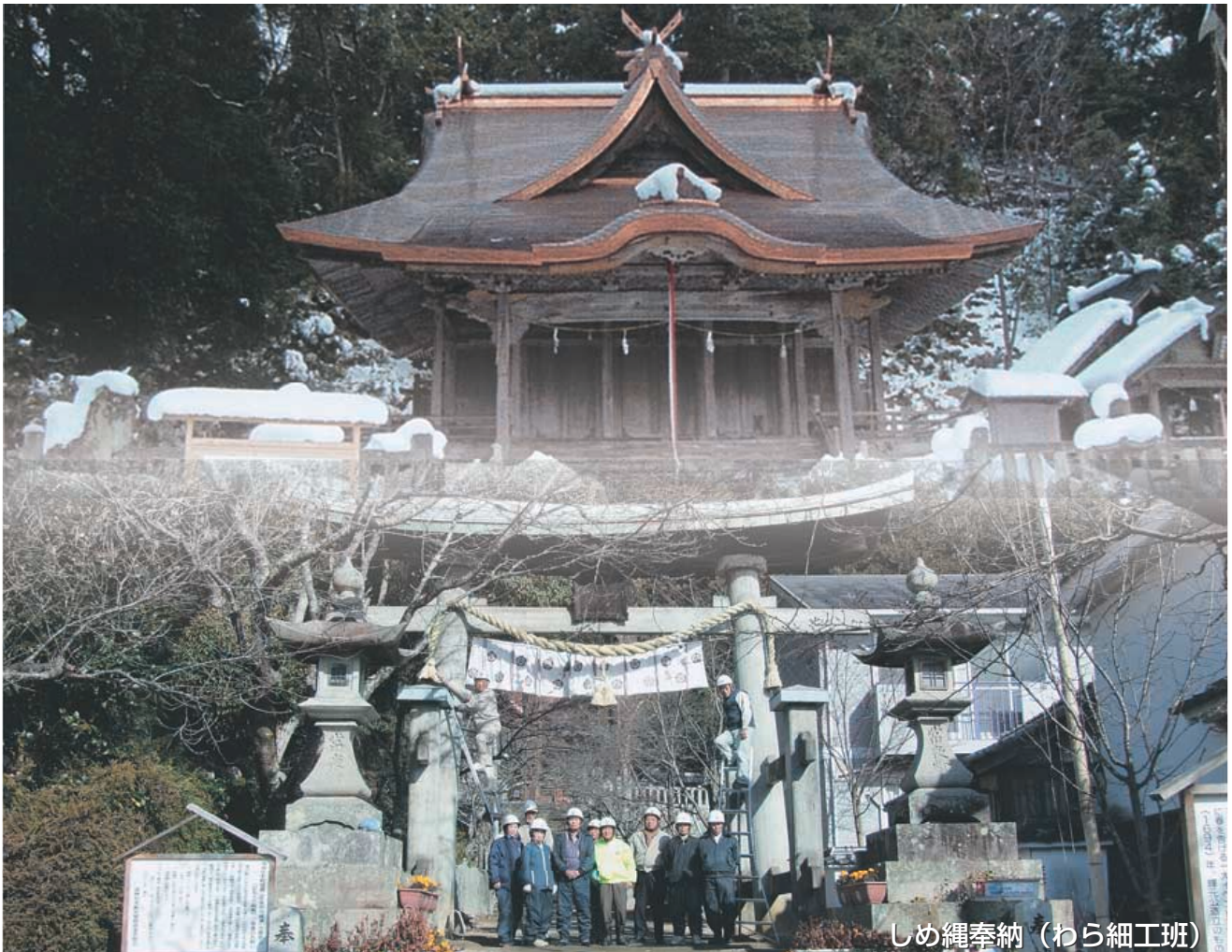
しめ縄奉納（わら細工班）