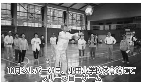
10月シルバーの日、小田小学校体育館にてフリースローゲーム

互助会は、当分の間は今までおやり事業を進めてまいることとなりました。会員も新たな気持ちで自主・自立・共働・共助の理念のもとで相互扶助及び福利厚生を図り現在に至っております。甲田町地域会員互助会は平成十七年の行事として、四月花見「六月は、総会を兼ねて三次グラウンドホテル(写真)」や十月のシルバーの日の本会の事業と合同での親睦グラウンドゴルフ大会を「小田小学校にて予定をしていましたが、雨天の為に中止となり、小学校の体育館を借りてバスケットのフリースローゲーム」そして十二月の親睦会は七日に「皆生温泉日帰りの旅」を多数の参加を頂き実施しました。 以上甲田町地域会員互助会の報告とします。平成十八年度は、(社)安芸高田市シルバー人材センターを計画して親睦を深め相互扶助を図ればと思っております。 最後に皆様のご支援とご指導の程よろしくお願い申し上げます。