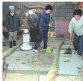
一わら細工加工一

会員さんがお客さまの依頼を受けて作業(就業)を行いますが、『安全就業』を完遂し、安全はすべてに優先することを第一義に実行し、家庭を大切に、安心して就業いただくためにも健康管理をしてください。