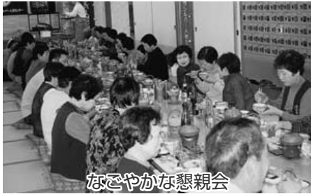
なごやかな懇親会

就業」を通して、支え合いの関係を大切にし、社会貢献が出来ることは自らの生き甲斐を創出することにもつながると思えます。会員互助会設立以来、役員は言うに及ばず、会員の皆さんの協力を頂きながら、恒例の年間行事を盛会裡に開催することが出来ました。 (一) 輪投げ大会(三十七名参加) 日時 六月五日(日) 場所 吉田運動公園体育館 (二) グラウンドゴルフ大会(八十一名) 日時 十月十六日(日) 場所 吉田運動公園 (三) 研修・交流会(八十五名) 日時 十月三十日(日) 場所 かんぽの宿 三瓶 秋空でのプレイ、懇親会での交流は多くの会員の楽しみとなっております。そこには、健やかに地域の仲間と触れ合い、新たな「元気出し」につながる要素が多分にあると思われれます。このように、互助会活動はシルバー事業をスムーズに潤滑させる役割をもつと同時に