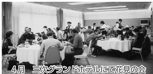
4月 三次グラウンドホテルにて花見の会

あけましておめでとうございませう。会員の皆様におかれましては、つつがなくご健勝のことと心よりお喜び申し上げます。平素は当互助会の運営に格別のご支援を賜り厚くお礼申し上げます。(社)甲田町シルバー人材センターは平成十七年四月一日をもって、(社)安芸高田市シルバー人材センターに統合されました。