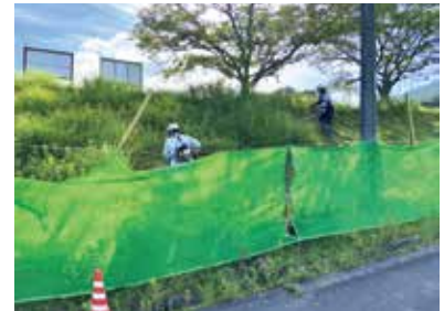
飛散防止ネット設置中