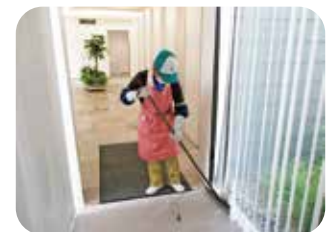
道の駅「三矢の里あきたかた」