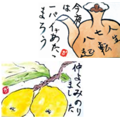
武田会員作の絵手紙

就業以外では、三矢大学（安芸高田市高齢者大学）や絵手紙のサークルなどに参加し、たくさん仲間たちと交流されています。自宅の畑では、季節ごとに野菜を作り、最近は近所の友達とそば打ちをされるなど、充実した日々を過ごされています。