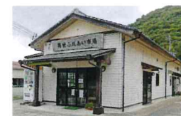
周世ふれあい市場

山頂ですが、水の切れる事のない井戸が有り「吹き出物」によく効くとされ小さいころその水を汲んできて、お風呂に入ったものでした。