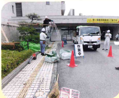
【剪定現場のパトロール】