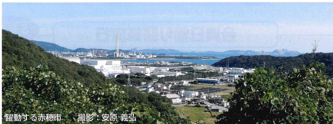
躍動する赤穂市