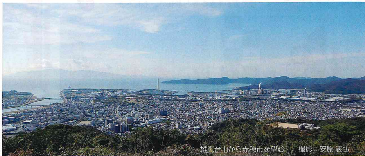
雄鷹台山から赤穂市を望む

報告によりますと、昨年度末の人口は4万6445人で、前年度に比べ676人の減少、60歳以上の人口は、