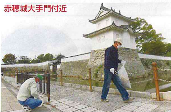
赤穂城大手門付近