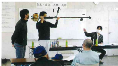
機器の安全取り扱い・点検法について