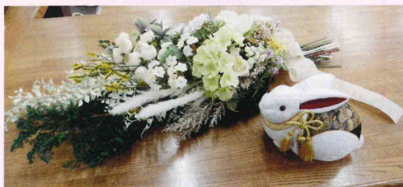
シルバーの事務所に飾っています