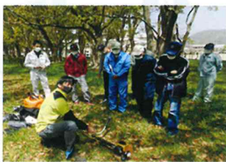
熱心に聞きいる受講者