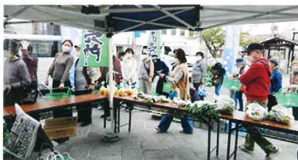
会計待ちの長蛇の列