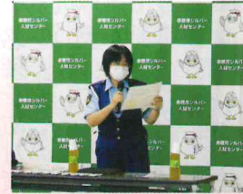
【熱心に受講しました】