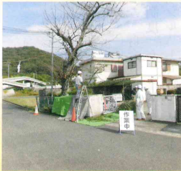
【剪定現場のパトロール】