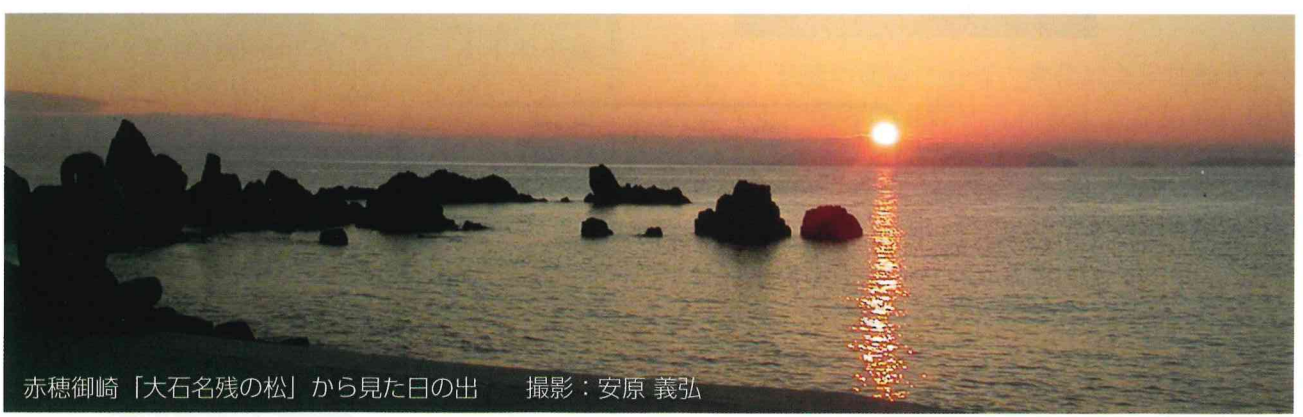
赤穂御崎「大石名残の松」から見た日の出