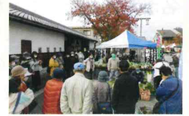
準備が終わるのを待っています