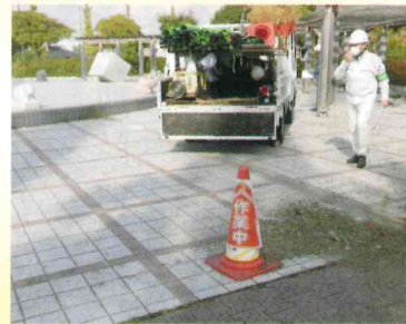
【草刈現場のパトロール】