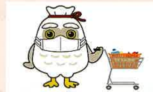
すいている時間に