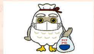
持ち帰り（テイクアウト）