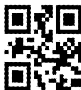
会員専用 QR コード