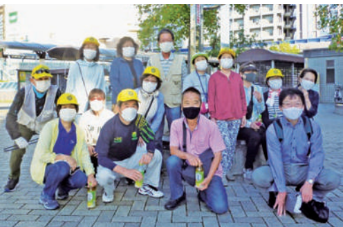
小田地域班の皆さん

平成二十九年一月に入会し てわずか四年余りで、地区事 務所所長という大役をまかさ れ、わけのわからないまま毎 日忙しい日々を送っています。 副代表・世話人の皆様に協 力頂きながら、会員の皆様に 少しでも楽しく就業してもら える様に頑張っています。 これからも明るく楽しい地 区事務所にしていけるよう、 皆様と共に励んで行きたいと 思っています。今後とも宜し くお願い致します。