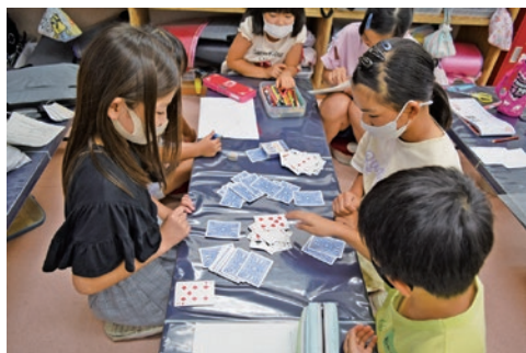
みんなでトランプ！