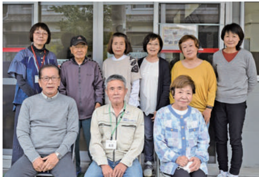
武庫地域班の皆さん

今年は通常通りの生活、行 事ができます様に、今年も役 員一同頑張つて参りますの で、会員皆様方の協力をお願 い申し上げます。