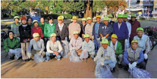
中央地域班の皆さん

新年明けましておめでとう ございます。 昨年は新型コロナウイルス 感染症の拡大により、仕事の 仕方や業務形態に大変なご苦 労をお掛けしましたが、会員 皆様の感染予防意識の高さに より、ご理解、ご協力いただ き心より感謝申し上げます。