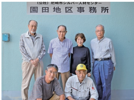
園田地域班の皆さん