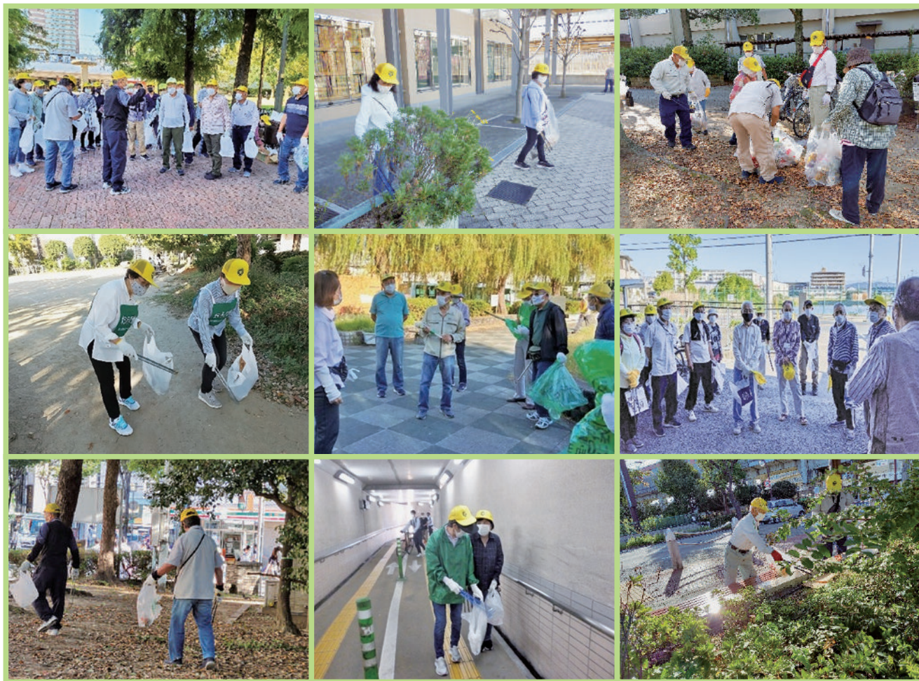
令和3年10月14日に各地区にて行われた清掃ボランティア活動 6地区106人の会員さんが参加しました