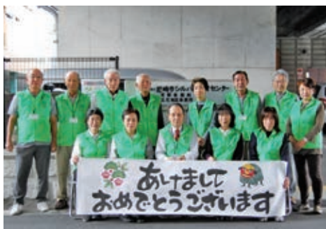
立花地域班の皆さん

新年おめでとうございます。昨年一昨年とコロナ禍により満足な活動が出来なく皆様にはご不便をおかけしました。本年度も残り少なくなりませんが、精一杯皆様のご期待に沿えるよう頑張つて参りますので、ご協力の程よろしくお願ひ申し上げます。