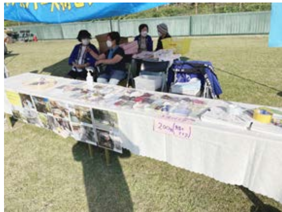
手芸作品やマスクの出品風景です。

秋晴れで日差しが照りつける中、女性会員が手作りした色とりどりのマスクを五四枚、ブローチやペンダントなどの手芸作品一〇二点を来場者に販売しました。市民まつりは三年ぶりの開催でしたが、たくさんの方にシルバー人材センターを知ってもらう良いPRとなりました。作品の製作をして頂いた手芸同好会の方々を始め、ご協力頂いた会員の皆様、ありがとうございました。