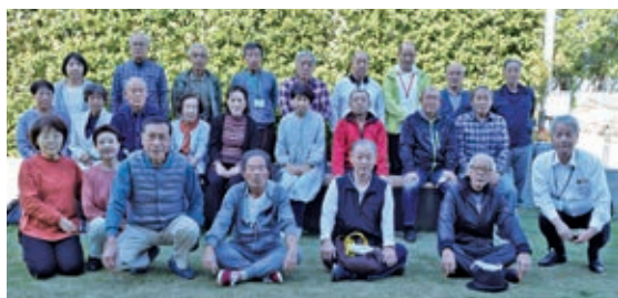
大庄地域班の皆さん

新年あけましておめでとうございます。昨年はコロナ禍により、あらゆる面で自粛を強いられました。ようやくコロナは収束方向、経済は活性化の兆しが見え「ウイズコロナ」のもと、日常生活は従前の状態に戻りつつあります。会員の皆様方には、心おきなく酒を飲み、語り歌えるような面白おかしく過ごせる一年でありますようお祈りします。