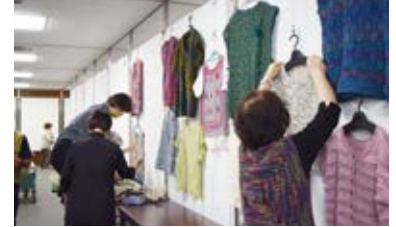
前 日 準 備 の 様 子