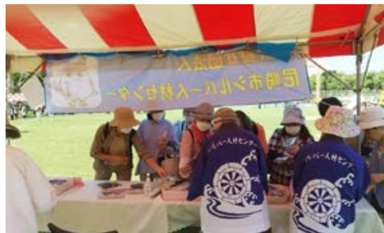
来場者はお子様連れのご家族も多く、当センターのブース也大賑わいでした。