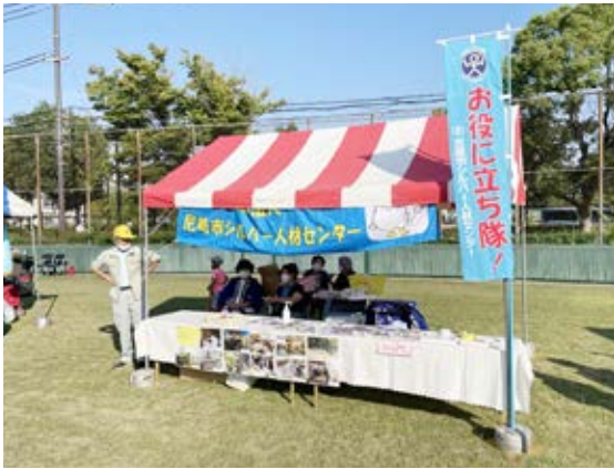
「お役に立ち隊!」のぼりを掲げて広報しました。

会場の一角に設けたブースにて、会員と職員が入会促進や受注拡大に向けたPR活動を行いました。また、会員手作りのマスクや手芸作品の販売も行いました。