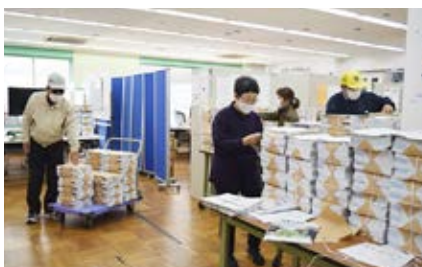
配布物仕分け作業の様子

*公園維持管理業務、配布業務をご希望の方はぜひ所属の地区事務所にお問い合わせください。