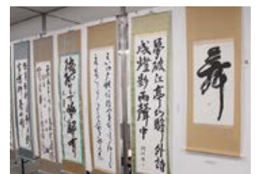
心のこもった作品の数々