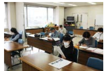
皆さん熱心に取り組まれています