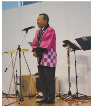
岩田会長による主催者あいさつ