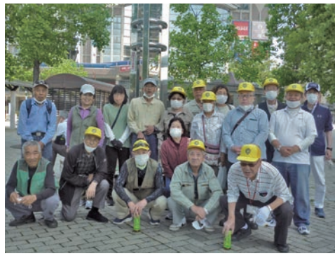
市クリーン運動 参加（小田地区）