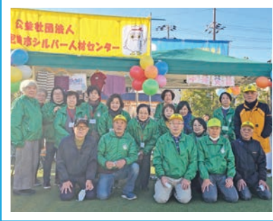
市のイベントに参加（中央地区）