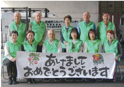
立花地域班の皆さん

コロナ禍もようやく終息 の兆しを見、新年を迎え、 心機一転新活動に向け皆様 のご協力を頂き、新規事業 に邁進頑張ります。 よろしくご協力お願い申 上げます。