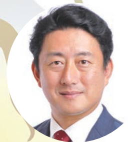
尼崎市長 松本 眞