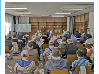
安全大会（園田地区）