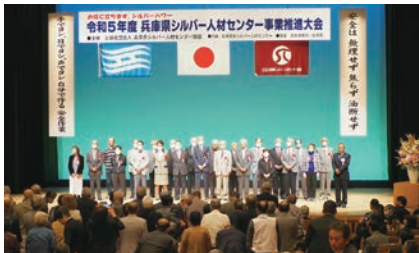
在籍25年・15年表彰の各センター会員の皆様

昨年10月20日（金）神戸新聞松方ホールにて、兵庫県シルバー人材センター事業推進大会が開催されました。当センターでは会員在籍25年として2人、15年として39人が表彰されました。 皆様、おめでとうございます。また、当センターは職員の勤続15年1人、また、事故ゼロ運動として、安全表彰を本部・支部事務所ともに受賞することができました。