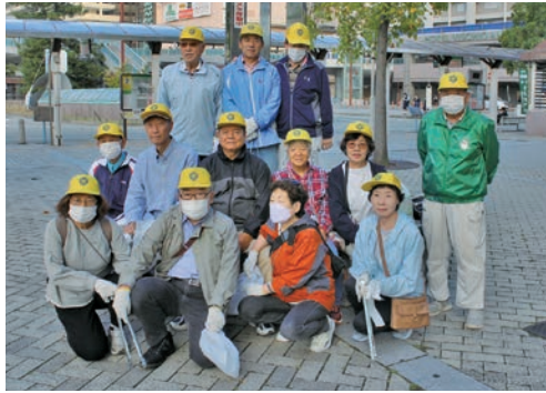
中央地域班の皆さん