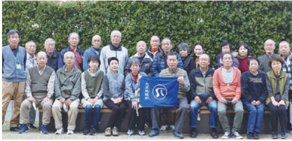
大庄地域班の皆さん

新年明けましておめでとうござ います。 昨年はコロナ禍の収束に伴い、 日帰りバス旅行が復活しました。 会員一人一人がシルバーに入っ てよかったです、日々生きがいを感じ、 心身ともに健康で過ごせるよ う、世話人の皆様と力を尽くして まいる所存です。 安全安心を最優先にご協力の程 お願い致します。