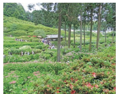
日帰りバス旅行（立花地区）