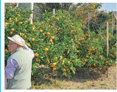
日帰りバス旅行（中央地区）