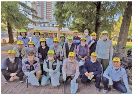
小田地域班の皆さん

新年あけましておめでとうございます。旧年中は皆様方には大変お世話になり、手助けをいただき、なんと1年が過ぎました。新たな年を迎えて振り返ってみますと、自分が出来て何が出来なかったか、この経験を糧に本年も精一杯頑張っていけます。皆様方には昨年同様宜しくお願いを致します。文末にはなりましたが、皆様には本年も昨年にも増して、良い年でありますようにと祈念し、新年のご挨拶とさせていただきます。改めまして、あけましておめでとうございます。