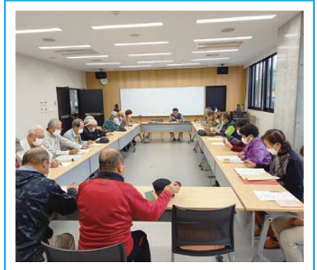
世話人会議（大庄地区）