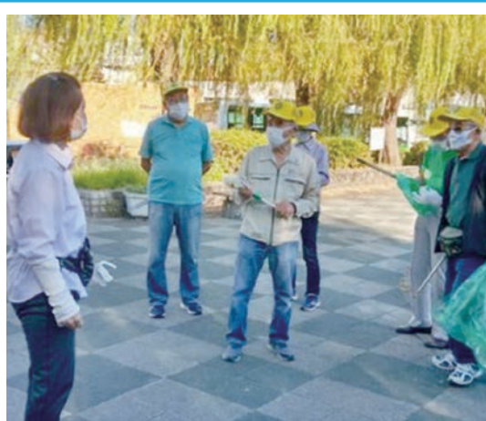
普及啓発促進月間・駅前清掃活動 （武庫地区）