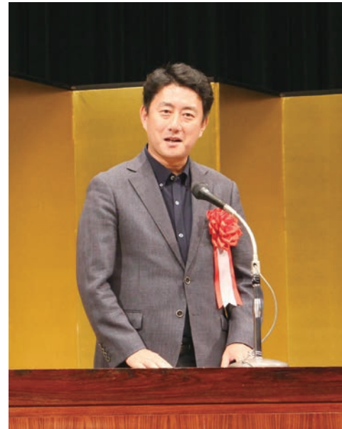
尼崎市市長松本様からの祝辞