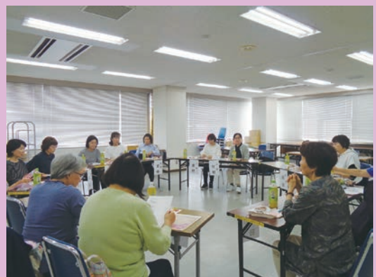
各地区のコーディネーターが集まり、活動について意見等を交わされました。