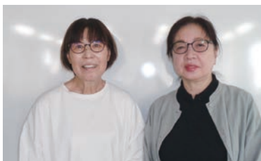
《小田》 重村・時水 (今泉、竹村欠席)