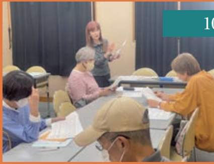
10月23日 武庫東生涯学習プラザ

センター初の試みでしたが、会員紹介キャンペーン期間中ということもあり、多くの方にご紹介いただき、合計30人がご入会されました。