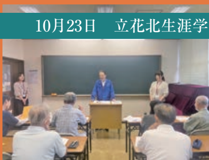
10月23日 立花北生涯学習プラザ