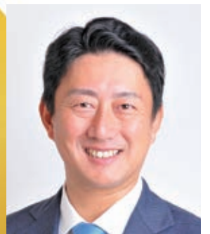
尼崎市市長 松本 眞