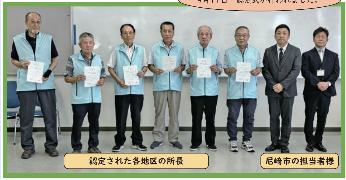
認定された各地区の所長