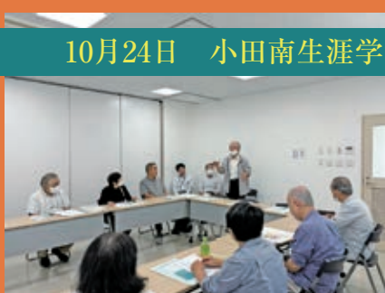
10月24日 小田南生涯学習プラザ