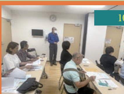
10月24日 園田東生涯学習プラザ