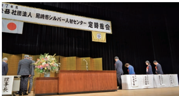
物故会員への黙祷