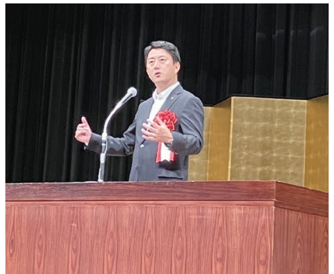
尼崎市 松本市長様からのご祝辞