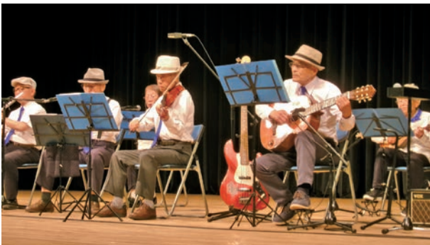
演奏同好会(ブルーシックス)