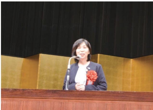
兵庫県阪神南県民センター 團野センター長様からのご祝辞