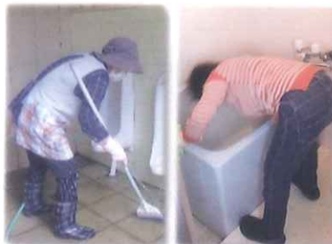
トイレ・浴槽清掃

上記は女性会員が行っている仕事の一例です。上記以外にも色々なお仕事がありますので、あなたに合った仕事が見つかります。