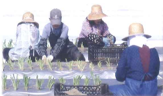
野菜の植付・手入れ・収穫