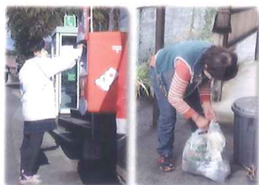
郵便出し・ゴミ出し