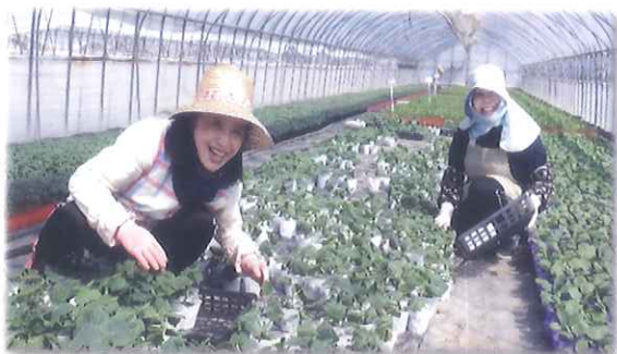
ハウス内ポット苗植付け