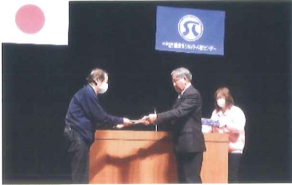
安全標語最優秀者表彰