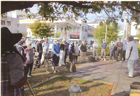
(参加会員 56 名 : 46.3%)