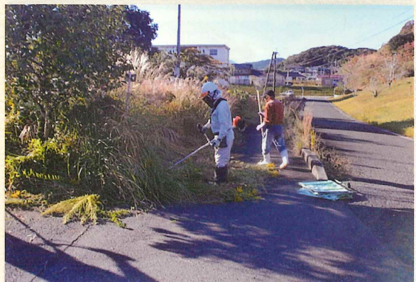
(参加会員 11 名 : 35.5%)