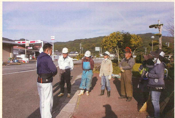
(参加会員 : 7 名 : 58.3%) ★ 第2位 ★