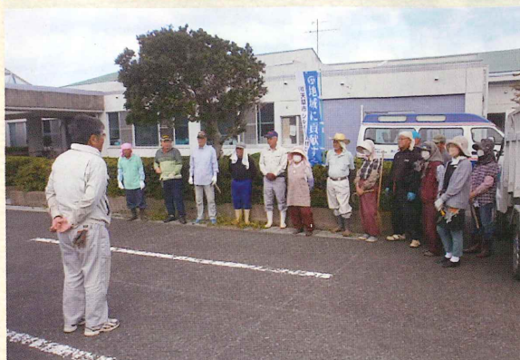
(参加会員 15 名 : 48%)