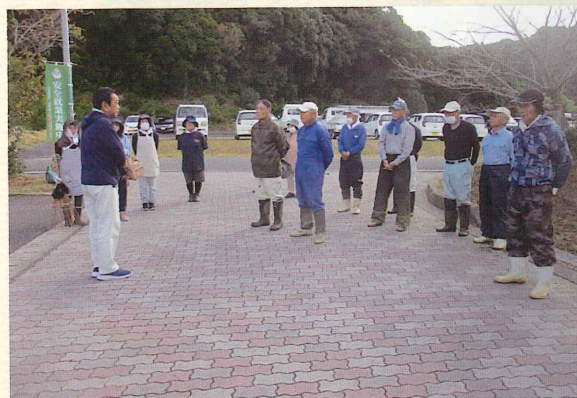
(参加会員 19 名 : 51.4%) ★第3位★