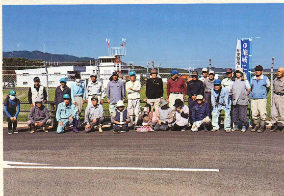
(参加会員 27 名 : 38.0%)