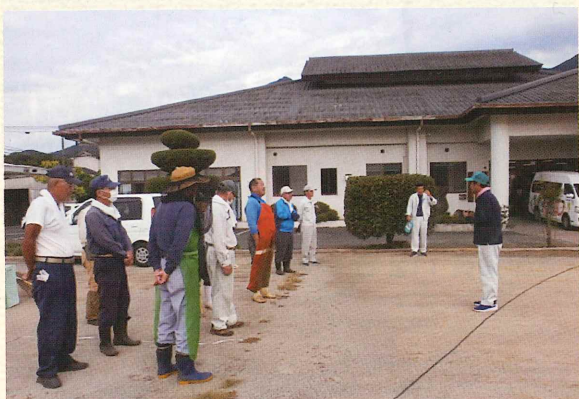
(参加会員 11 名 : 42.3%)