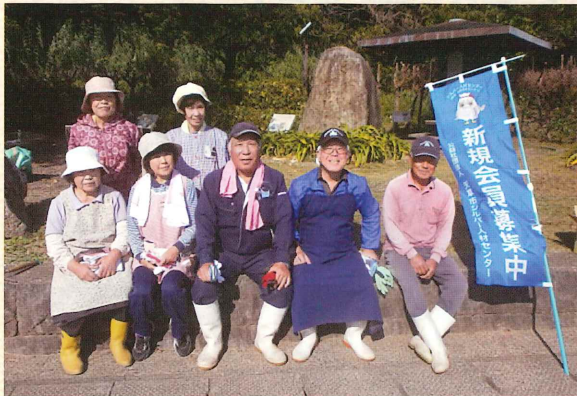
(参加会員 7 名 : 77.8%) 👑 第1位 👑