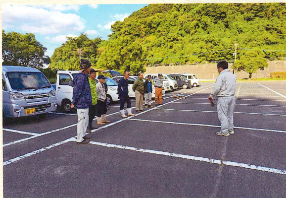
(参加会員 10 名 : 50.0%)