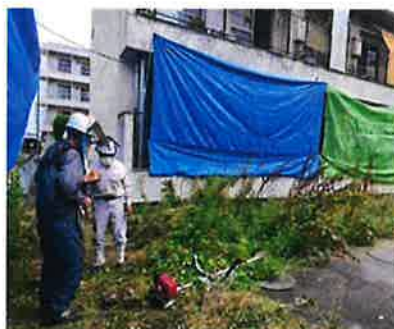
※就業パトロールの状況