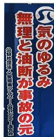
※安全就業スローガン （啓発用のぼり）