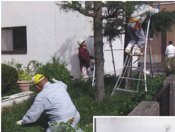
女性センター剪定 (H29.10.24)