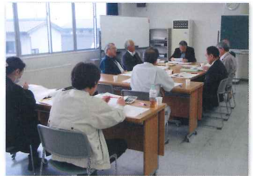
総務・財政委員会 (H29.11.29)