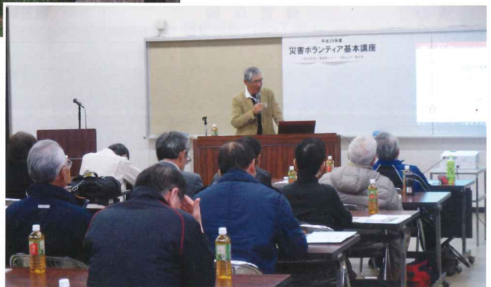
災害ボランティア基本講座 (H29.12.4 開催)

したが、天候の影響により昨年と比べて収穫量が減りましたが、収穫できた11俵につきましては、おかげさまで完売することが出来ました。