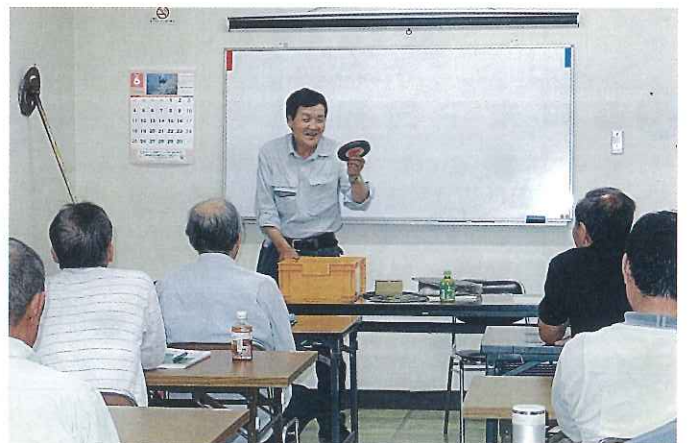
草刈機安全衛生教育講習会