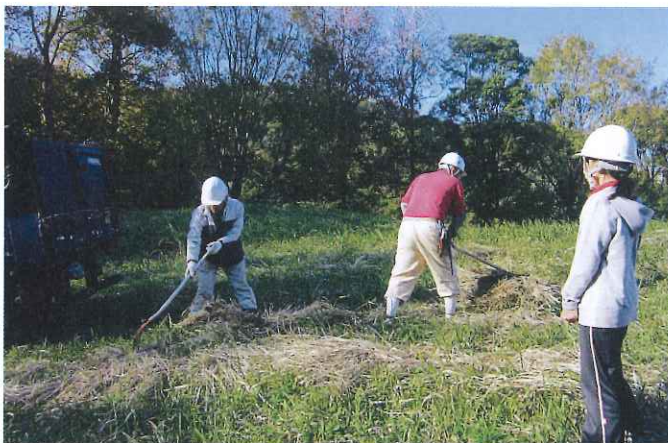
安全委員による巡回パトロール