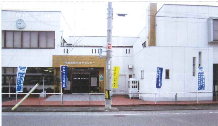
普及のほりの設置