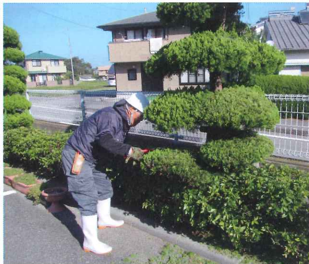
福寿荘剪定ボランティア (H29.10.26)