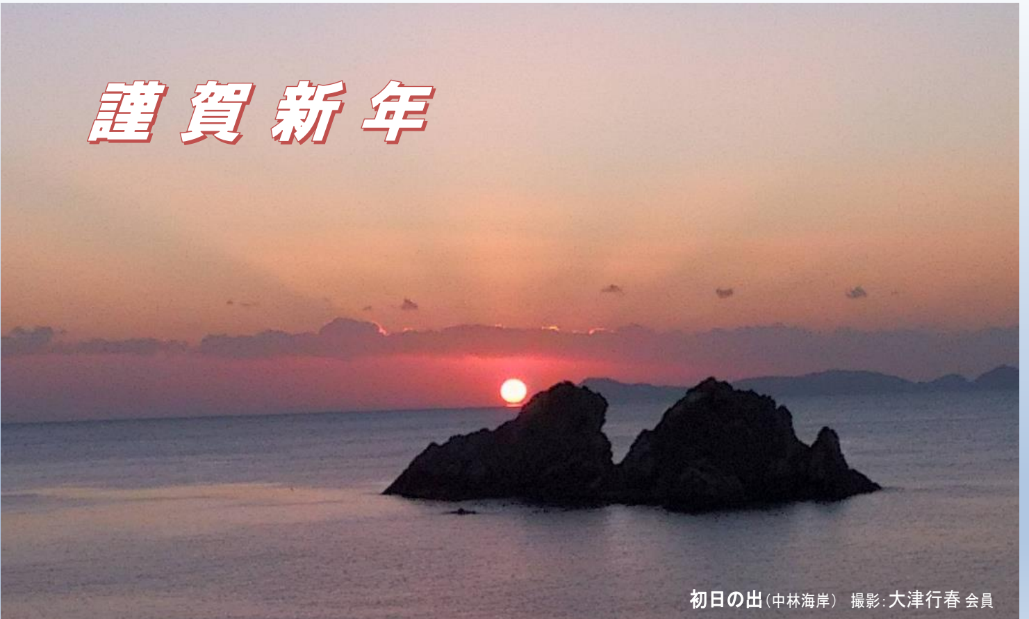
初日の出(中林海岸)