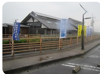
啓発のぼりの設置(那賀川町)