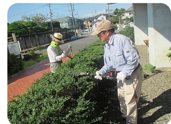
剪定ボランティア(領家町)