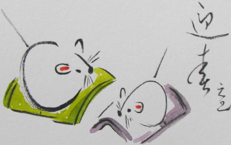
イラスト / 住友 修子 会員