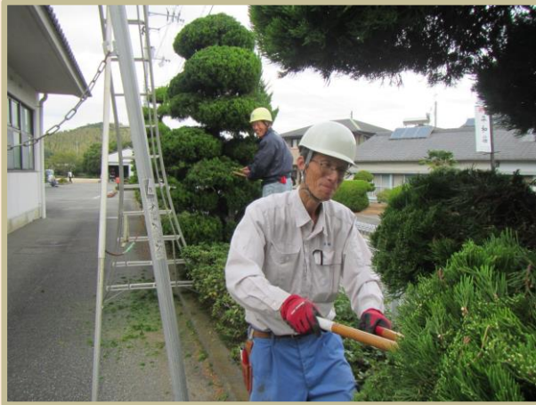
老人ホーム福寿荘 (畷町)