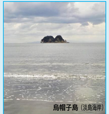
烏帽子島 (淡島海岸)