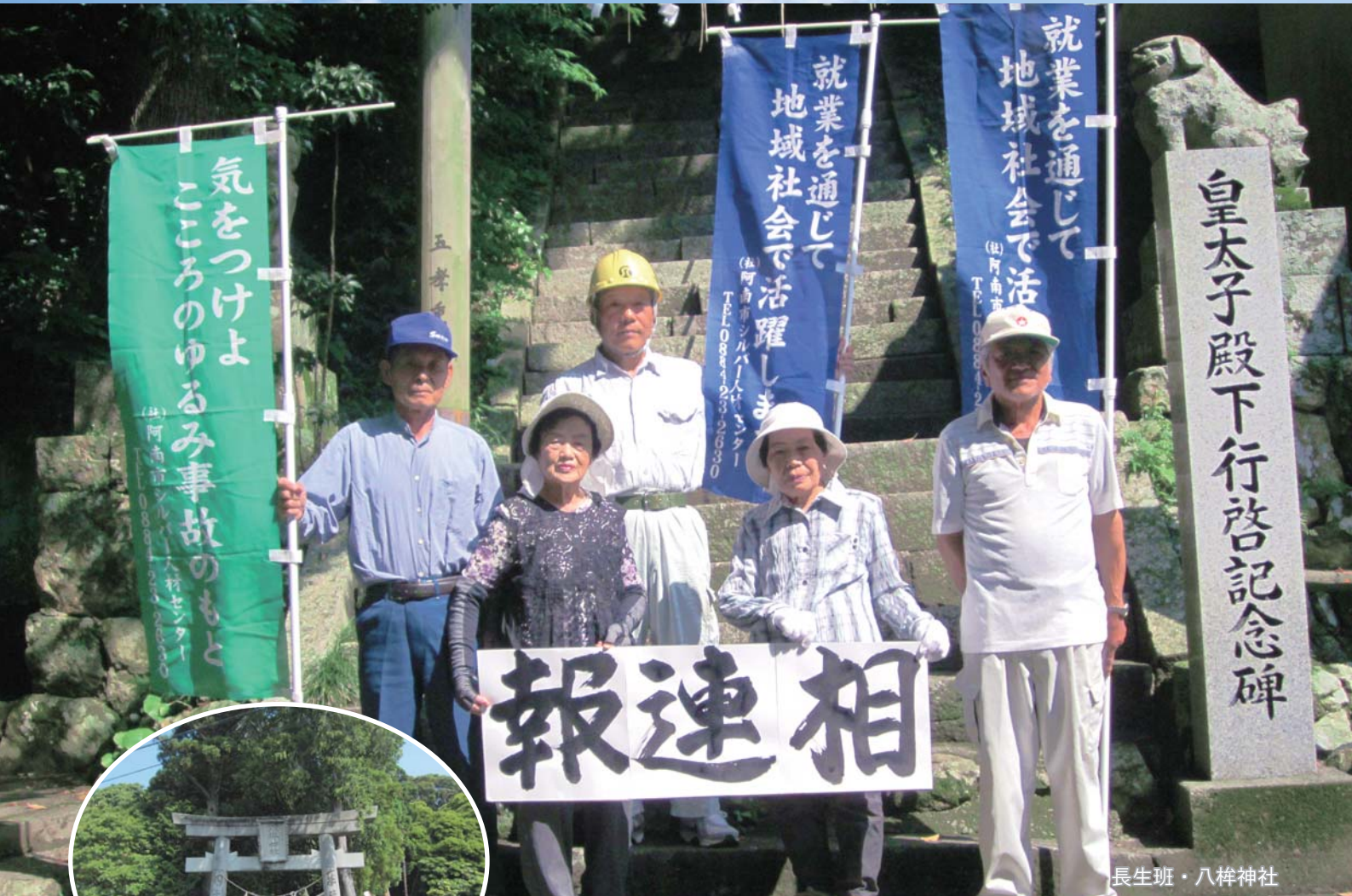
長生班・八梓神社