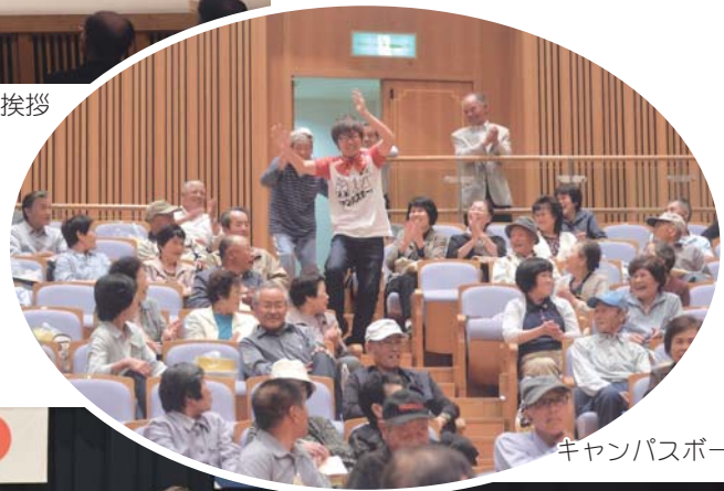
キャンパスボーイ