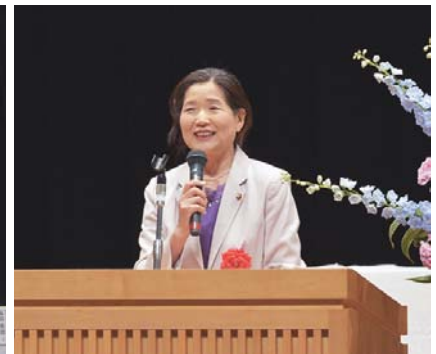
阿南市議会議長挨拶