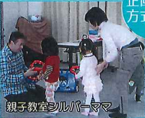
親子教室シルバーママ