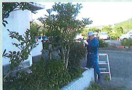
福寿荘剪定ボランティア