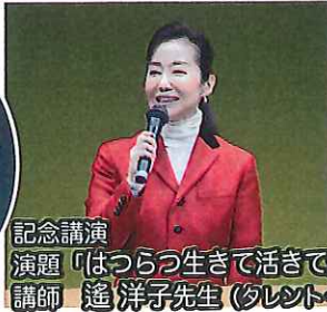
記念講演 演題「はつらつ生きて生きて輝いて」 講師 遙 洋子先生(タレント・作家)