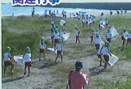
淡島海岸清掃ボランティア