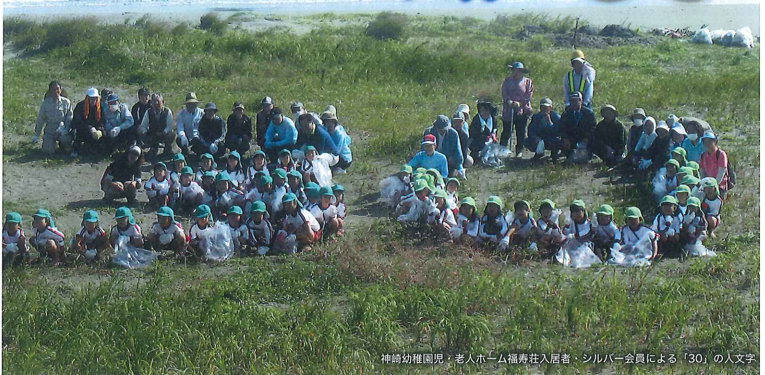
神崎幼稚園児・老人ホーム福寿荘入居者・シルバー会員による「30」の人文字