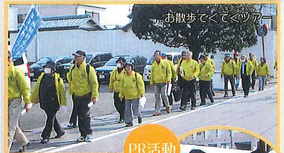
お散歩てくてくツアー