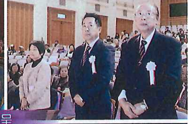
感謝状・表彰状贈呈