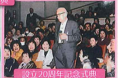
設立20周年記念式典 早川一光先生による記念講演