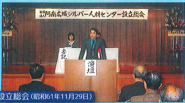
設立総会(昭和61年11月29日)