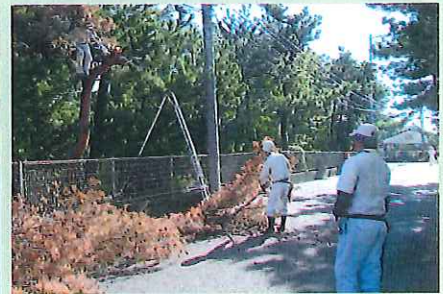
神崎幼稚園剪定ボランティア