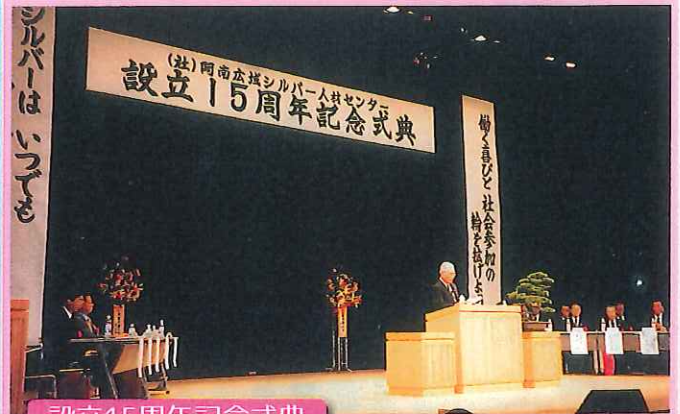
設立15周年記念式典