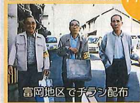
富岡地区でチラシ配布