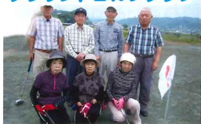
週2回練習と大会開催