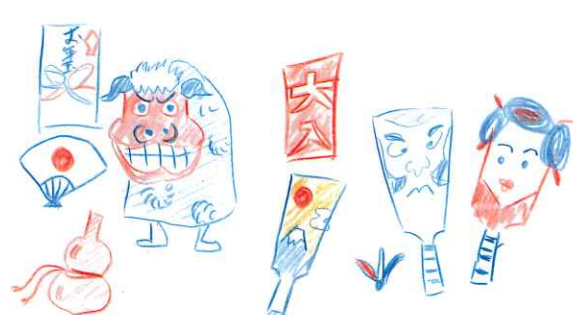
イラスト 松本 孝夫 会員