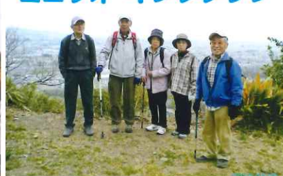
年数回近隣名所へ