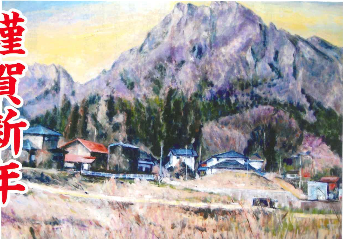
「晩秋の妙義山」画 松本 孝夫 会員